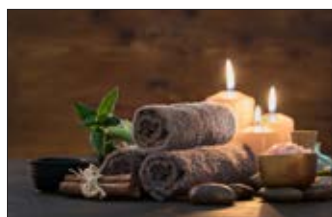
Rituel du Spa