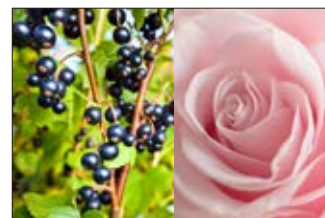
Baie de roses