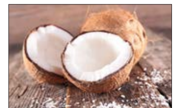
Noix de coco