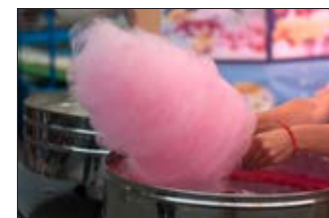
Barbe à papa