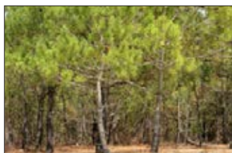
Pin des Landes