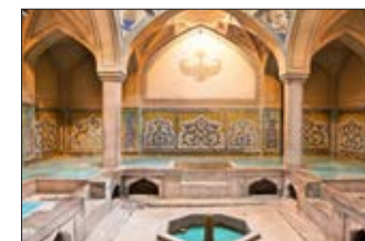
Rituel du Hammam