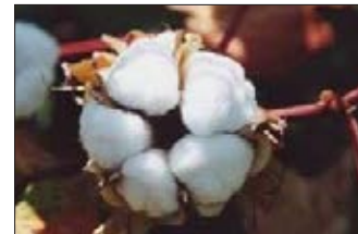
Fleur de coton