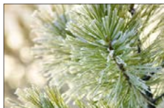
Cèdre du Liban