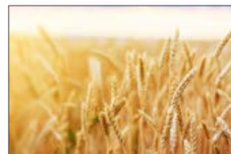
Champ de blé